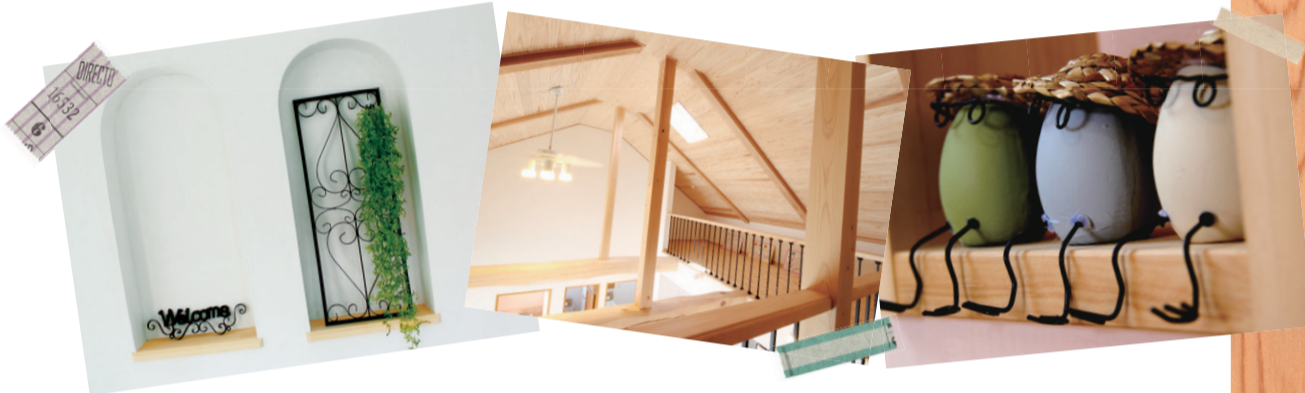
※写真はすべてイメージです。実際のものとは異なります。